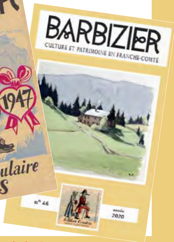
Table générale des Almanach (A.1 à A.17 : 1943, 1947-1963) et du Bulletin ou Revue (B.1 à B.46 : 1967-2020)